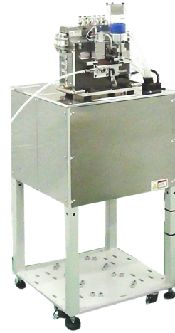
専用架台搭載 Mounted on dedicated stand

※写真にはオプションが装着されています ※Photo: Machine with optional units